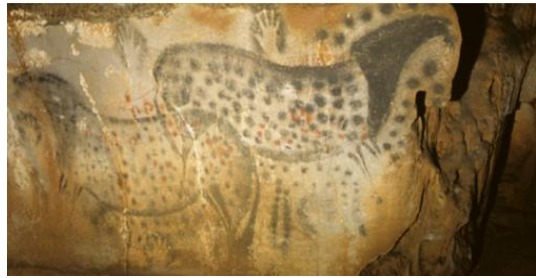
Peintures murales de chevaux

La Grotte du Pech Merle est une grotte ornée préhistorique. Elle offre un échantillon complet de formations géologiques naturelles, parmi lesquelles se succèdent peintures et gravures préhistoriques de plus de 29 000 ans. Mammouths, chevaux, bisons, signes, mains, silhouettes humains et traces de pas faciles à observer, ornent cette grotte qui permet d'admirer une des plus belles expressions artistiques de la Préhistoire. Visites guidées sur réservation.