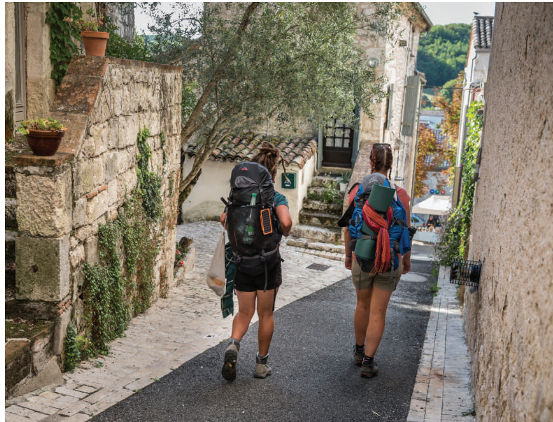
Pélerines dans le village de Montcuq - ©A.Auzanneau - Office de Tourisme Cahors Vallée du Lot

Magnifique panorama sur les paysages vallonnés alentour.