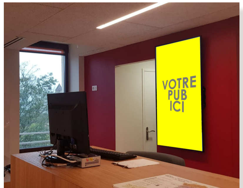
Ecran espace accueil - Office de Tourisme Puy-l'Evêque - Vinoltis