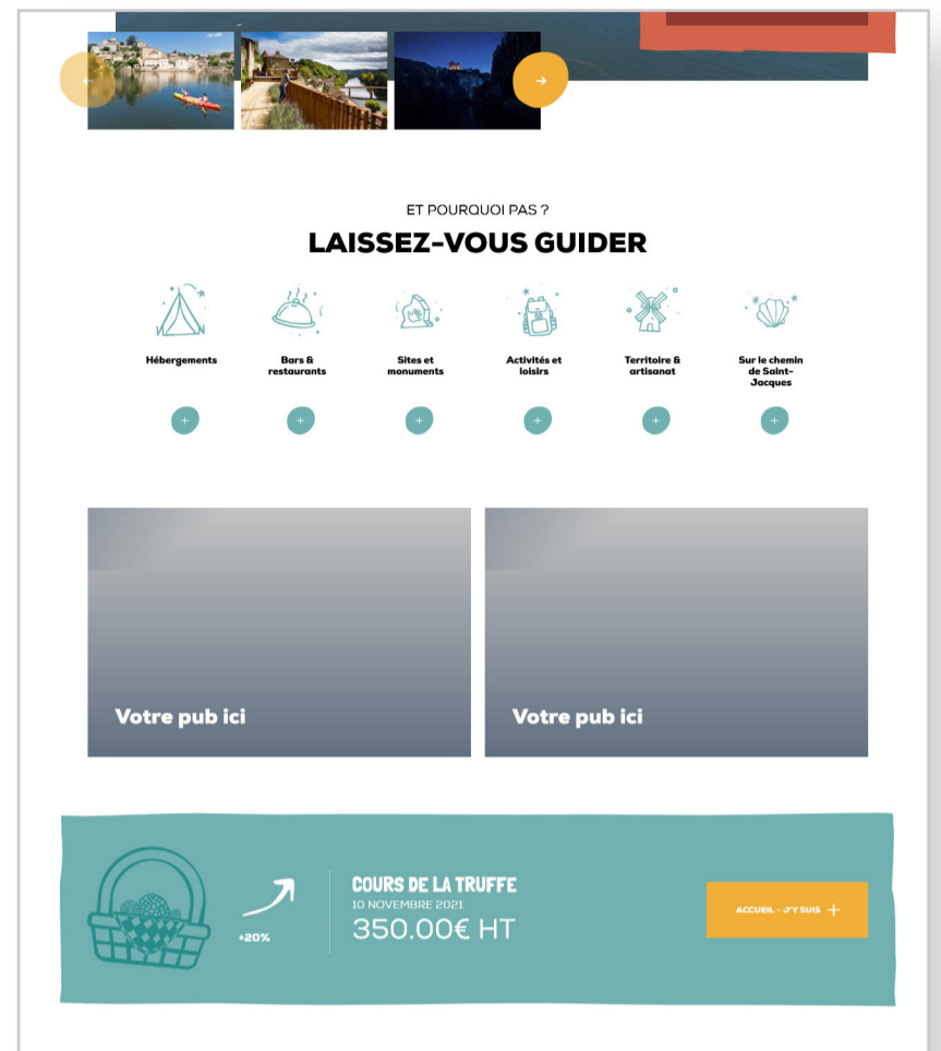
www.cahorsvalleedulot.com - maquette page d'accueil

DE 105 À 252€ HT 8 pages vues 9 915 fois (oct 22 - sept 23)